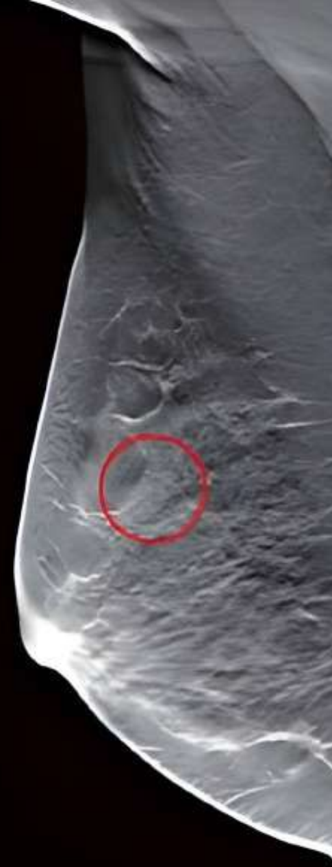
3D tomo image

Con la actualización de Tomosíntesis , el modelo de tomografía digital 3000A 2D ahora es capaz de generar imágenes tridimensionales para diagnósticos más precisos que nunca.