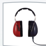
Audífonos de CA DD65 v2