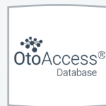
Base de datos OtoAccess®