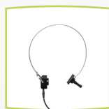
Audífonos de CO B71