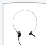
Audífonos de CO B81