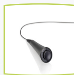
Interruptor de respuesta del paciente

Las especificaciones están sujetas a cambios sin notificación.