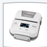
Juego de impresora HM-E300