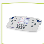
Dispositivo MA 42